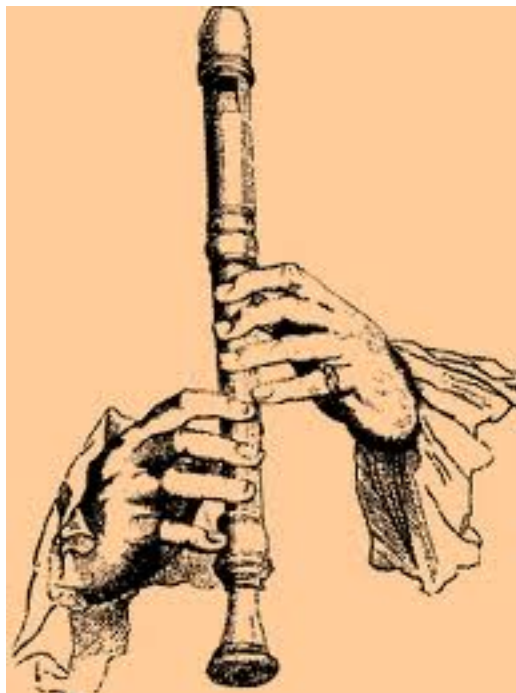
Hotteterre, Principes de la flûte, 1701