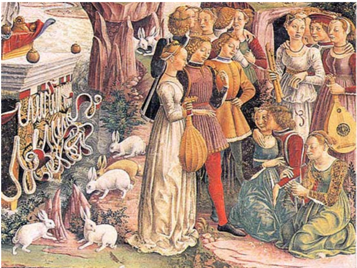
Francesco del Cossa (1436-1478), Le triomphe de Vénus (fragment), palazzo Schifanoia, Ferrara.