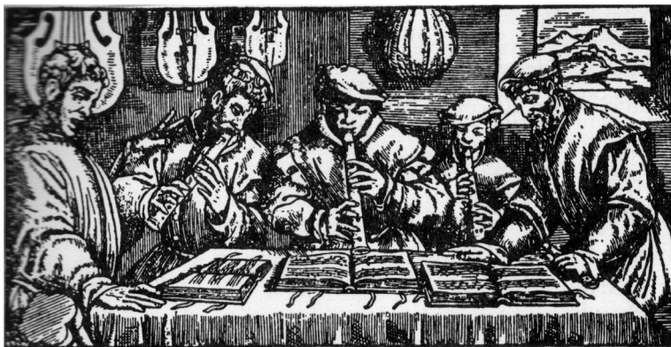
Sylvestro Ganassi, La Fontegara, Frontispice du traité sur la flûte à bec