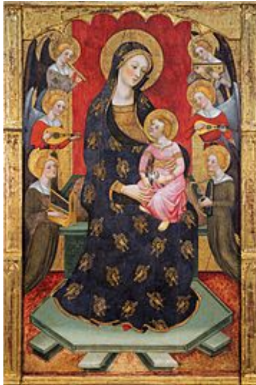
Tableau du père Serra (Barcelone XIVè) : retable : Vierge Marie + Jésus + 6 anges jouant divers instruments : le 1er ange joue de la flûte à bec de forme clairement cylindrique